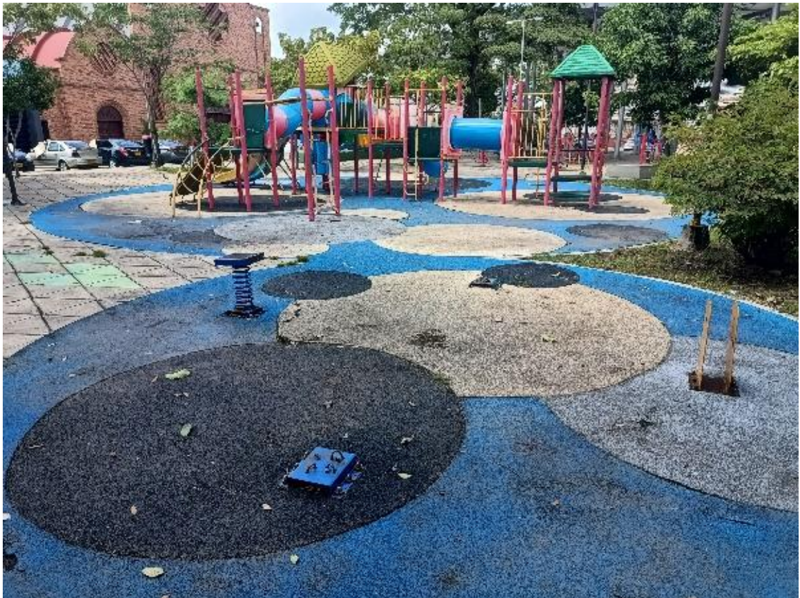
Figura 2. Fotografía actual del parque

En la actualidad el parque infantil cuenta con una zona infantil, una polideportiva, zona de gimnasio y diversas zonas verdes, algunos de estos espacios se encuentran en deterioro, al igual que los andenes y las zonas verdes. Dificultando la accesibilidad al mismo.